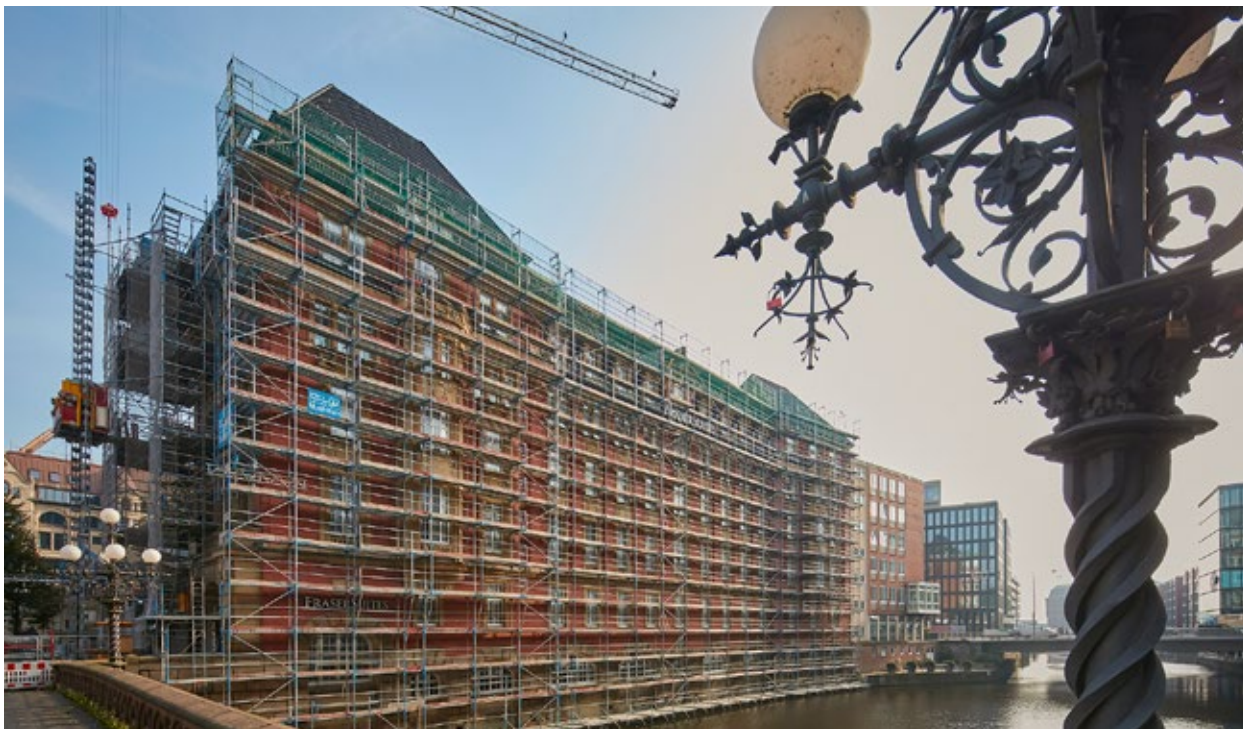
Gerüstbau in Hamburg