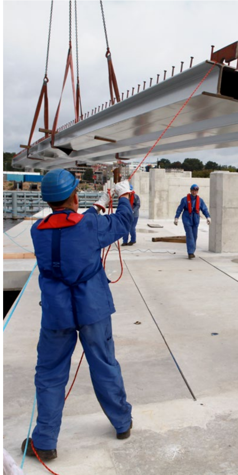
Stahlbrückenbau in Polen

Die Muehlhan Gruppe ist aktuell auf drei Kontinenten präsent. In Europa ist die Gruppe mit 18 Tochterunternehmen vertreten. Im Nahen Osten ist die Muehlhan Gruppe mit drei operativen Gesellschaften in den Vereinigten Arabischen Emiraten, in Katar und im Oman vertreten, ein Ausbau der Aktivitäten in der Region ist in Vorbereitung. In Nordamerika ist Muehlhan hauptsächlich in den Staaten an der Westküste präsent. Die Region Rest der Welt umfasst die im Wesentlichen auf Ölförderanlagen vor den Küsten Brasiliens und Afrikas aktive MSI mit ihren zwei Tochtergesellschaften.