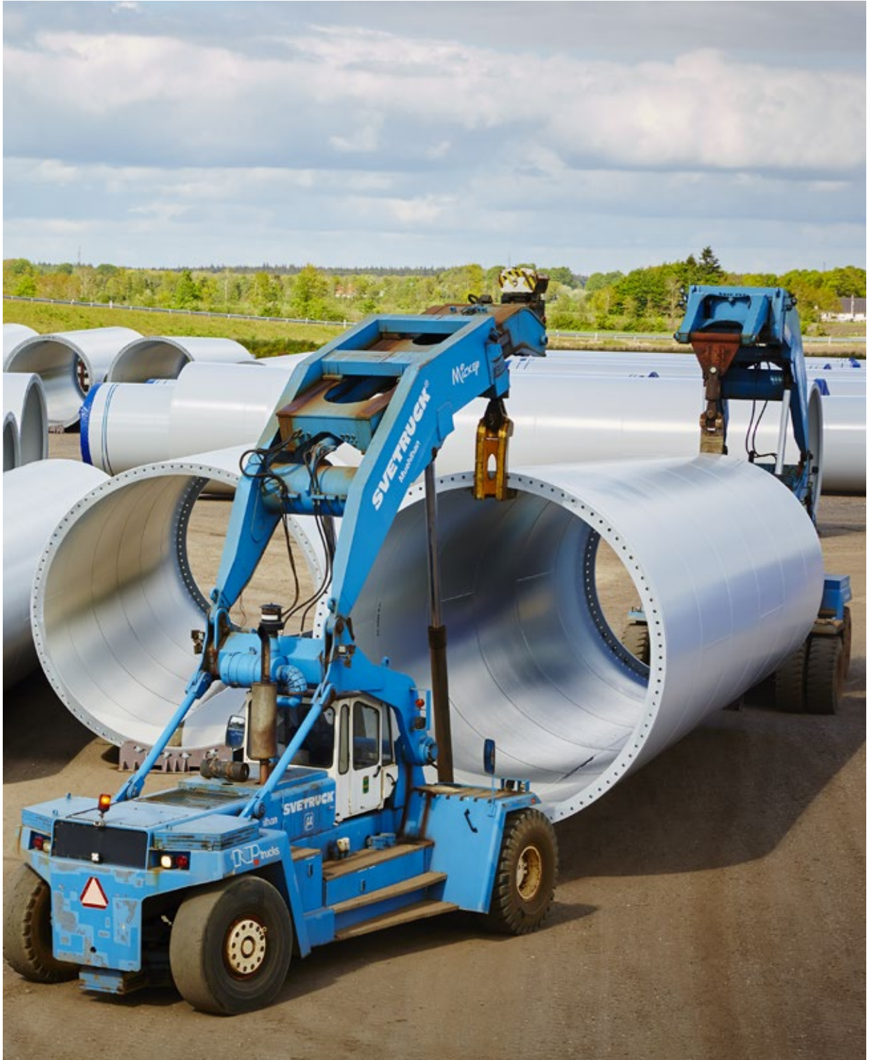
Transport von Windkraftanlagensegmenten