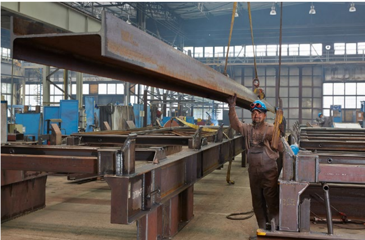
Stahlbau in Stettin/Polen

Das Geschäftsjahr des Konzerns, der Muttergesellschaft sowie aller in den Konzernabschluss einbezogenen Tochtergesellschaften ist das Kalenderjahr.