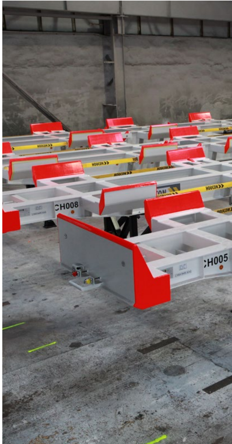
Stahlbau in Stettin/Polen

Die Gesellschaft hat ihren Sitz in der Schlinckstraße 3 in 21107 Hamburg, Deutschland, und ist in das Handelsregister beim Amtsgericht Hamburg (HRB 97812) eingetragen.