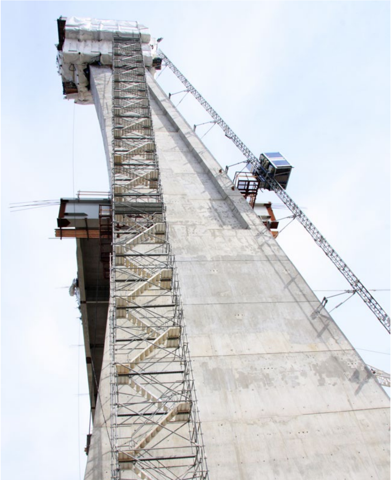
Gerüstbau- und Beschichtungsarbeiten beim Brückenbau in St. Petersburg/Russland