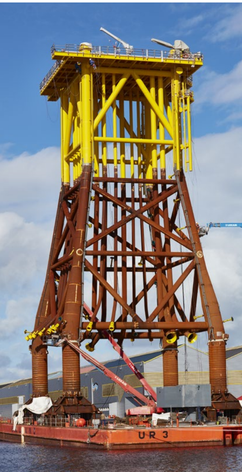
Jacket-Konstruktion für Offshore-Windkraftanlagen in Saint-Nazaire/Frankreich