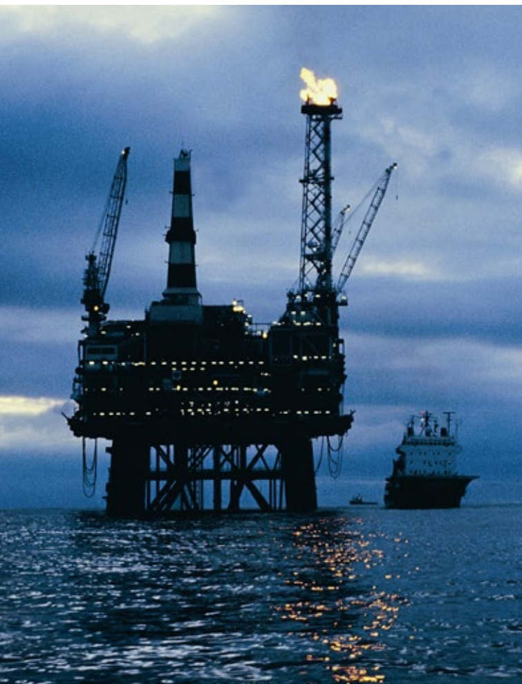
Ölplattform in der Nordsee

Für das Jahr 2018 und die Folgejahre wird jeweils eine Pensionszahlung auf dem Niveau des Berichtsjahres erwartet.