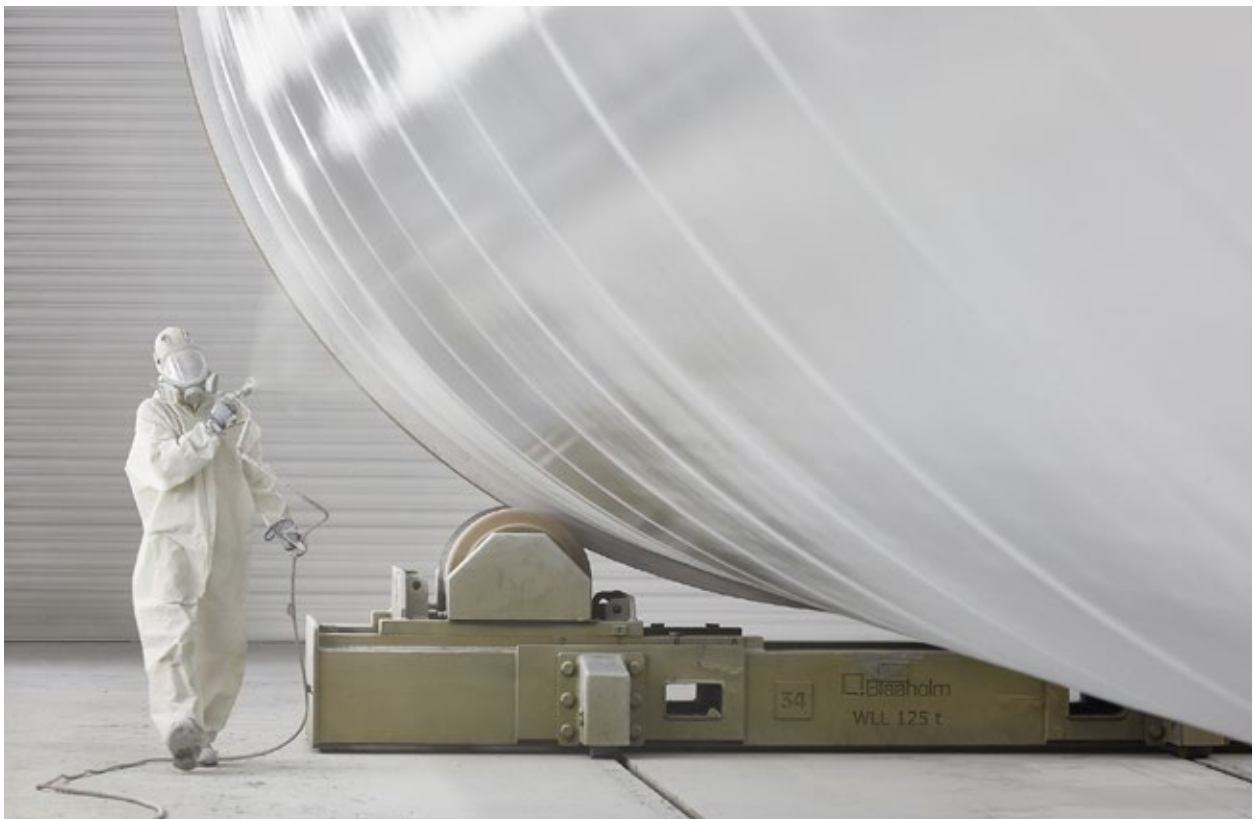
Aufbringen von Oberflächenbeschichtung auf Turmsegment von Windkraftanlagen in Givé/Dänemark

Auf Konsolidierungseffekte werden latente Steuern angesetzt.