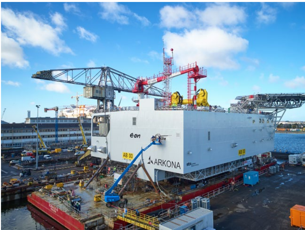
Offshore-Transformerplattform in Saint-Nazaire/Frankreich

Durch die Angabe in Millionen Euro oder Tausend Euro kann es bei der Addition zu Rundungsdifferenzen kommen, da die Berechnungen der Einzelpositionen auf ganzen Zahlen beruhen.